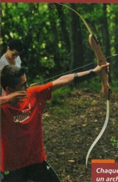
Chaque équipe comprend au moins un archer sans viseur

aux archers, diverses activités telles que le VTT, la sarbacane, le speed ball, du tennis en fauteuil roulant (grâce à l'aide de nos amis handisport), les quilles de neuf (jeu ancien pratiqué dans les Pyrénées)... Le soutien