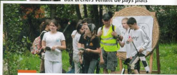
Le parcours comprenait aussi une épreuve d'orientation