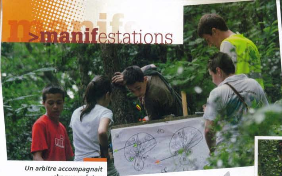
Un arbitre accompagnait chaque peloton