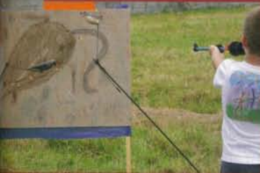
Un rassemblement de tir à la sarbacane avait aussi lieu

aux archers, diverses activités telles que le VTT, la sarbacane, le speed ball, du tennis en fauteuil roulant (grâce à l'aide de nos amis handisport), les quilles de neuf (jeu ancien pratiqué dans les Pyrénées)... Le soutien