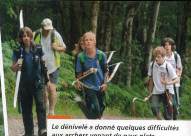
Le dénivelé a donné quelques difficultés aux archers venant de pays plats